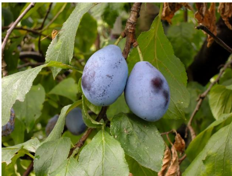
Prunus domestica L. cv Čiešpa di Clastra