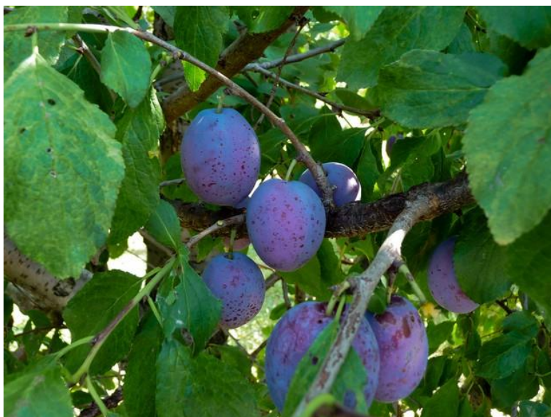
Prunus domestica L. cv Sant'Anna di Trampus