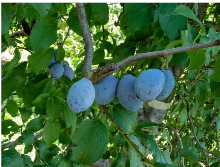
Prunus domestica L. cv Prissica